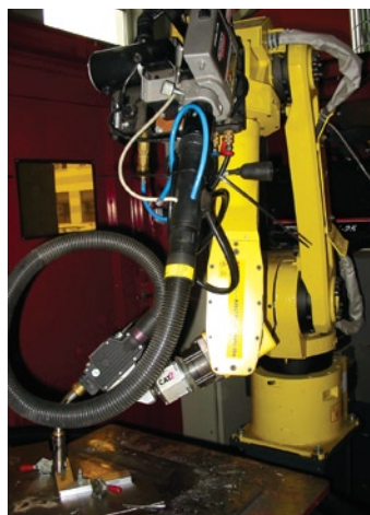
Zainstalowany robot spawalniczy

Paletyzowanie to przykład zadania porządkowania przypadkowo rozmieszczonych przedmiotów według zadanego programu. Podawane przez przenośnik lub pobierane w inny sposób przedmioty należy ułożyć w żądany sposób. Rozpoznanie położenia przedmiotów wykonują odpowiednie czujniki, systemy wizyjne lub są one mechanicznie pozycjonowane. Pozostaje uchwycenie, przeniesienie i ułożenie we właściwej pozycji dużej liczby elementów – możliwie szybko i bez błędów. Szybkość i dokładność wykonywania tego typu czynności przez roboty jest nieporównywalna z możliwościami człowieka. Przykład zasto-